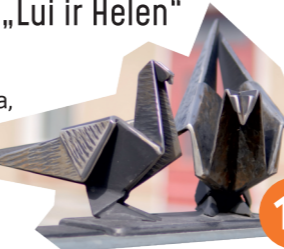
„Lui ir Helen“

12. Balandžių pora „Lui ir Helen“, pavadinti Lui Brailio - brailio rašto kūrėjo, ir Helen Keller - JAV visuomenės veikėjos, paprašiusios LIONS klubo tapti „aklųjų riteriais kryžiaus keliais žygyje prieš tamsą“, garbei, kviečia perskaityti brailio raštu užrašytus grupės „Antis“ dainos „Zombiai“ žodžius. Antuanas de Sent Egziuperi savo knygoje „Mažasis princas“ yra parašęs: „Tai, kas svarbiausia, nematoma akimis“... Kad visada atsimintumėte, jog matyti galima tik širdimi, užsimerkite ir perbraukite ranka brailio rašto eilutes, puošiančias tilto turėklą. GPS: 55.251313, 24.767267